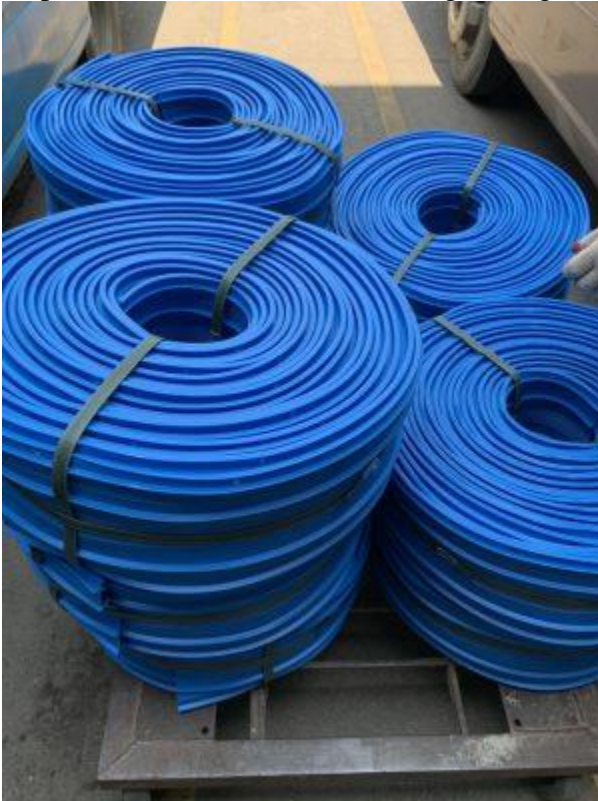
Băng cản nước PVC V200[/caption]

[caption id="attachment_2880" align="aligncenter" width="300"]